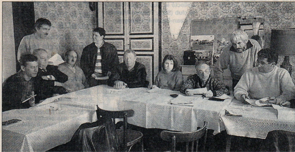
Les membres du bureau

Le club organisera le samedi 31 mai un concours en doublette (40 F + 50 %). Les concours-entraînements en nocturne, seront du vendredi 20 juin au vendredi 12 septembre, la coupe cantonale se déroulera à Mouterre les samedis 13 ou 20 septembre ; le méchoui le samedi 6 septembre (avec une petite participation des membres) et le maître-joueur en nocturne, avec