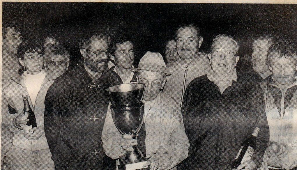
L'équipe du club local.